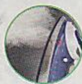
Table à repasser