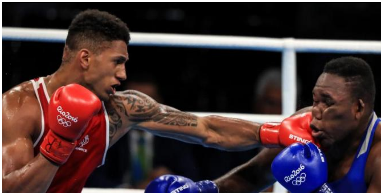
Tony Yoka, médaille d'or aux JO de Rio, 2016